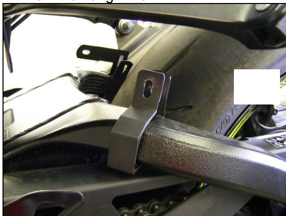
in Fahrtrichtung links